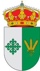
EXCMO. AYTO POZUELO DE VILLA DEL CAMPO