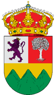
EXCMO. AYTO VILLANUEVA DE LA SIERRA